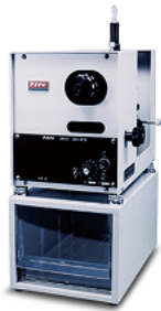
CA-D / DT / A