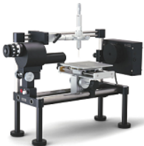
Drop Master 100