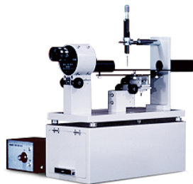
CA-S150 / 350